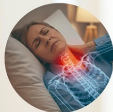
Insomnio y migrañas